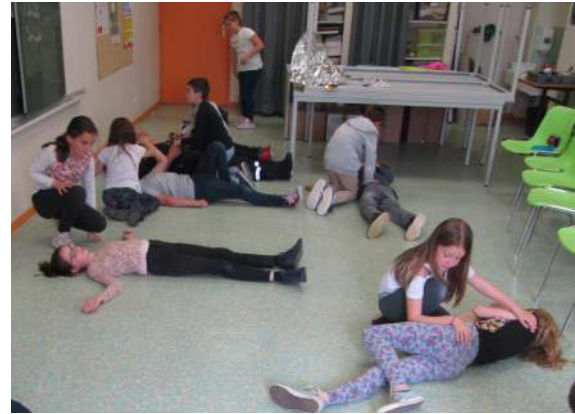
Les pompiers à l'école

Il en est de même avec votre messagerie internet car afin de limiter la prolifération des papiers, toutes les informations transitent par ce biais là.