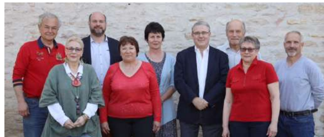
Le Conseil d'Administration - 22/05/2019

Venez nous rejoindre nombreux pour participer à cette aventure marquée sous le sceau de l'ouverture et de la convivialité. Vous pouvez nous contacter ou passer nous voir au Forum des associations de Fontaines le 31 août 2019.