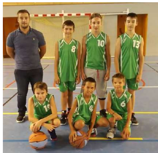
L'équipe des benjamins de 10 à 11 ans

Sans oublier les différentes animations organisées par les membres du bureau comme :