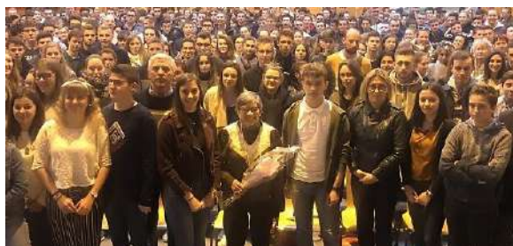
Ginette KOLINKA entourée des élèves du lycée - 2019

De nombreuses promotions ont eu la chance de pouvoir réaliser des voyages d'études en France et à l'étranger. Pour exemple, le voyage des délégués de classe en Pologne, à la découverte du camp de concentration d'Auschwitz, a été un temps fort, très riche en émotions. Préalablement, les élèves ont pu assister au témoignage de Ginette KOLINKA, survivante du camp de concentration d'Auschwitz-Birkenau et passeuse de mémoire de la Shoah.