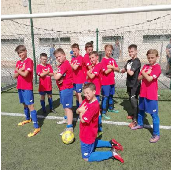
équipe U13, finaliste du tournoi de Beaune

Nous rappelons que l'école de football est une entente entre la JS Rully et l'AS Fontenoise afin d'avoir suffisamment d'effectifs et de structures pour que les jeunes puissent pratiquer le football dans de bonnes conditions.