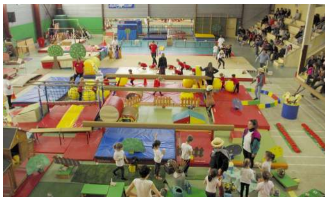
Rencontre Interclub Éveil Global de l'Enfant Avril 2019

La section Éveil de l'Enfant s'adresse aux tout petits à partir de 2 ans. L'animatrice est diplômée AF3 par notre Fédération FSCF, et la Claire Fontaine a reçu le label Enfant'Éveil. Nous avons organisé cette année la rencontre Bourgogne Sud, à laquelle ont participé plus de 100 enfants de 6 clubs.