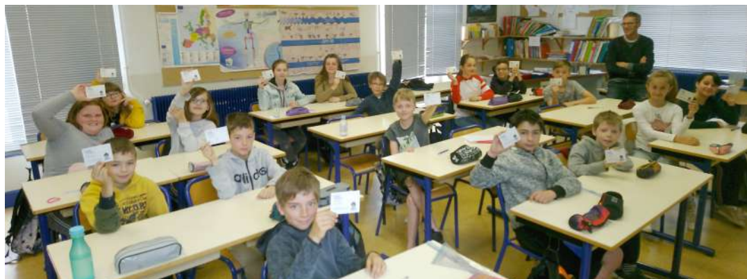
<= Permis piétons CM2

Cette nouvelle année scolaire donnera le jour à de nouveaux projets dont vos enfants ne tarderont pas à vous en parler. L'équipe enseignante tient à remercier la municipalité pour tous les investissements et travaux effectués au cours de l'année.