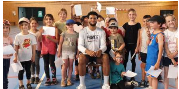
Les CP/CE2 au basket

Roxane FOUQUET pour l'équipe enseignante de l'école élémentaire.