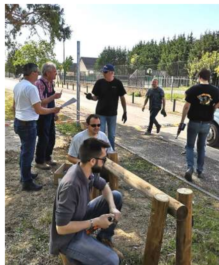
journée citoyenne 2019

Chaque année, l'association participe à la fête de Pâques de Fontaines en proposant une buvette pour vous rafraîchir, rue du Moulin.