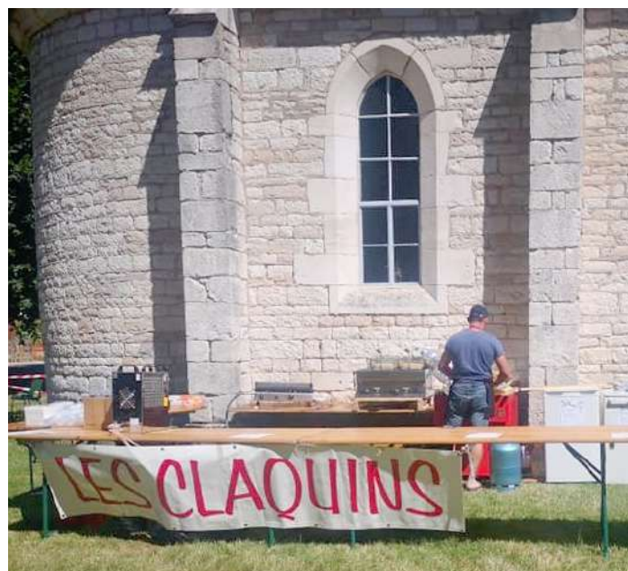
Préparation de fête de l'école