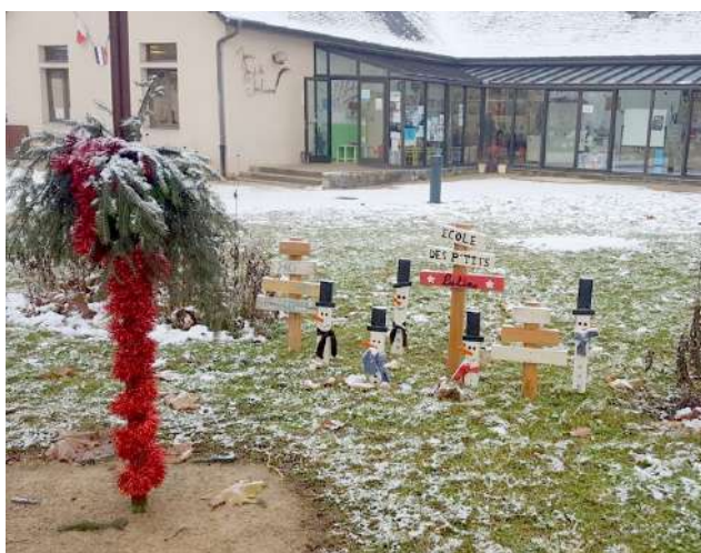
Décoration de Noël pour l'école maternelle

L'organisation ainsi que la préparation de ces événements se fait toujours dans une ambiance bon enfant et détendue.