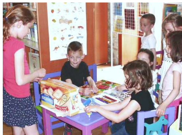
activités avec les enfants