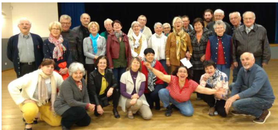
Chorale Fanny Choeur

L'association a tenu sa troisième Assemblée Générale le lundi 13 novembre 2018 à Fontaines.