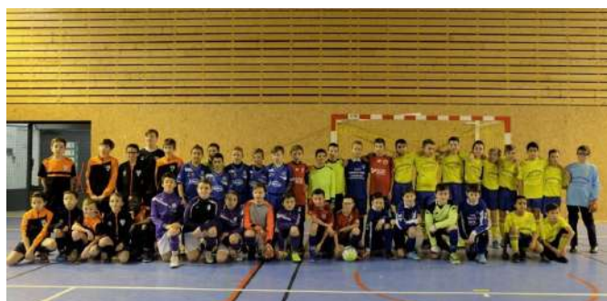
tournoi futsal

Responsable : Sébastien DESMICHEL (éducateur fédéral CFF1, 06 80 03 54 64)