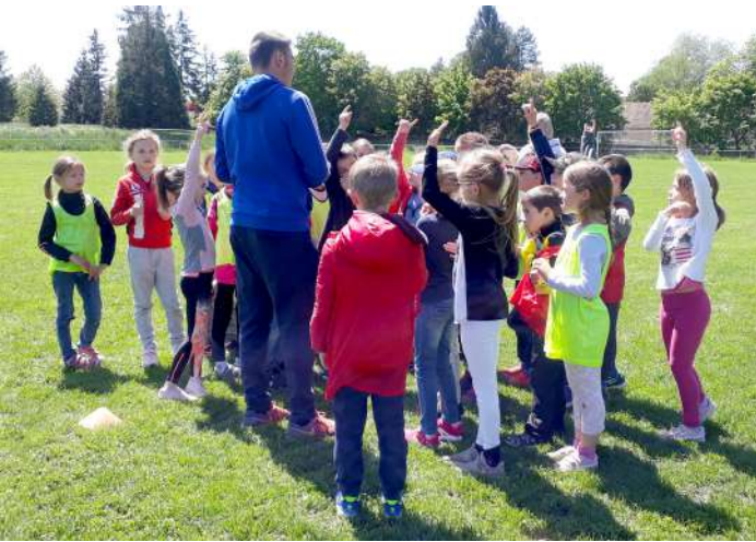
Les CE1 au rugby

Alors n'hésitez pas à le consulter régulièrement.