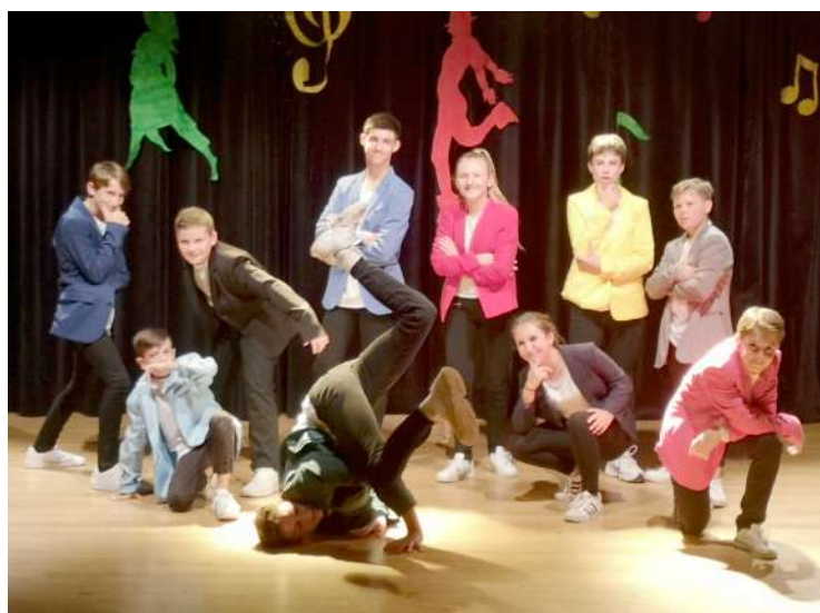
Spectacle de danse 2019

Nous vous donnons rendez-vous au forum associatif le 31 août prochain où vous pourrez découvrir l'ensemble de nos activités et nous pourrons répondre à toutes vos questions.