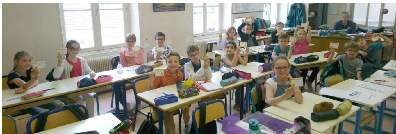
Permis piétons CE2