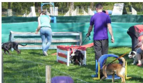
Jeux du chiot

Généralement, il y a 2 groupes de niveau chaque semaine. Plus l'éducation canine est commencée tôt, plus la sociabilisation et l'écoute du chien est rapide. Nous sensibilisons les maîtres au ramassage des déjections afin de participer à la propreté des villes, des parcs, etc.