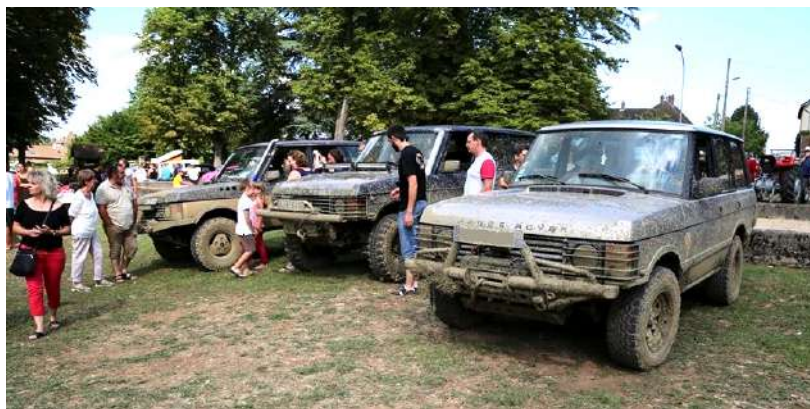
Les Roues'Yotines 2018

Une page facebook a été mise en place pour toutes inscriptions sur places limitées, permettant de rencontrer les divers passionnés de 4x4 régionaux dans le cadre d'une journée de détente.