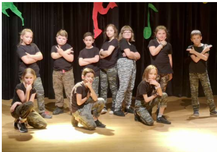
Spectacle de danse 2019