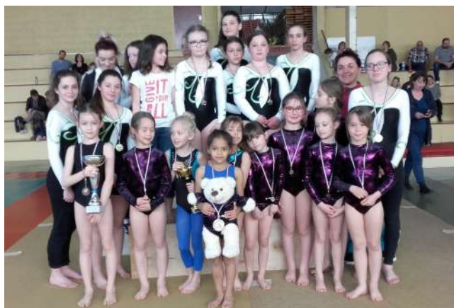
Challenge Gym Filles de la Claire Fontaine Mars 2019

En Sports, nos sections cette année se composent de : Gymnastique filles et garçons (plusieurs groupes d'âge), Badminton et Tir à l'arc. Nous ouvrirons sur demande des sections de Gym détente, Marche rapide, et Judo. Ces sections, animées par des instructeurs diplômés bénévoles, participent (notamment la Gymnastique Féminine et le Tir à l'Arc) à